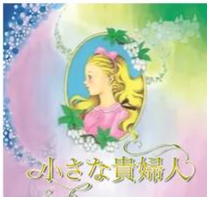
アイバンクミュージカル 「小さな貴婦人」

昨年までの11年間で12,532人を動員したアイバンクミュージカルを今年はストーリーを新たに開催することが決定いたしました！