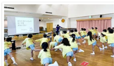
まねっこ体操！元気いっぱい！

今回は、65名の年長児さんたちに話をしてきました。ポーズをマネして遊ぶ「まねっこ体操」や、目の錯覚を利用したクイズなどを通して、「目と脳がつながっていること」を伝え、自分の目は自分で守ることが大切なんだということもしっかりと聞いてくれました^^