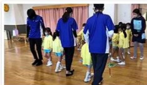
みんなで手引きの練習

そろそろと歩いてくれる肩から伝わる振動は、みんなの一生懸命さが伝わってきてめちゃくちゃ嬉しかったです^^_