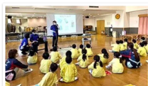
サポート機器の話をしっかり聞いてくれました