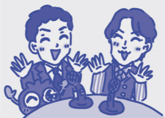
ブルブルくん しゅちよ〜 マツモトヒロト