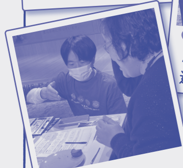
♥️🔄 正直な感想を教えてくださいました!