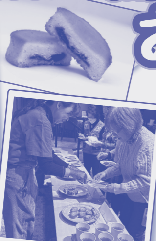
♥️🔄 バイキング形式で選ぶ体験から!