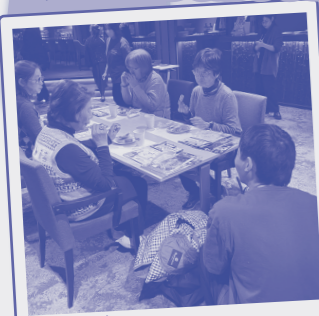
♥️🔄 スタッフと会話をしながら実食♪