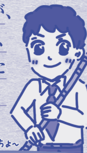
青年時代のしやちよ〜