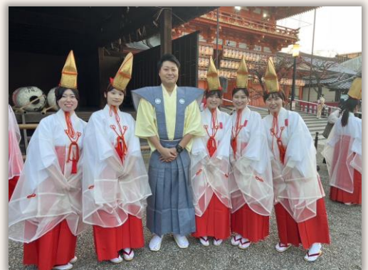
選抜された福娘と町内会会長 （2024）

八坂神社では、毎年1月9日と10日に「祇園のえべっさん」と呼ばれる祭事が行われます。 この行事は商売繁盛を祈願するもので、多くの商業関係者が参拝します。 福娘たちは、四条通沿いの商店街に福笹を届け、商売繁盛の福を授けます。 わかさ生活からは毎年福娘として女性社員が数名選出されており、福娘の活動をしています。