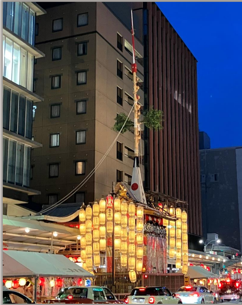
本社前に建つ長刀鉾

日本三大祭りの一つ“祇園祭”の象徴ともいえる“山鉾巡行”。その先頭を担う「長刀鉾」は祇園祭期間中、わかさ生活本社の前に建ちます。 祇園祭は、町人の力で支えられる京都の歴史的な祭りですが、長刀鉾町町内会はその町内の企業がその役割を持ちます。 わかさ生活は、地域の一員として地域社会への貢献活動に取り組んでまいります。