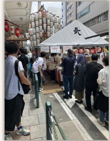
長刀鉾の粽販売所

祇園祭の期間中、わかさ生活本社前の四条通にて、朝9時頃より長刀鉾の粽やその他グッズが販売されます。待ち時間が3時間以上になるほどの行列ができるため、列の整理や安全確保を行わなければなりません。かなりの人手を要する活動のため、わかさ生活からも数名の男性従業員が参加しました。